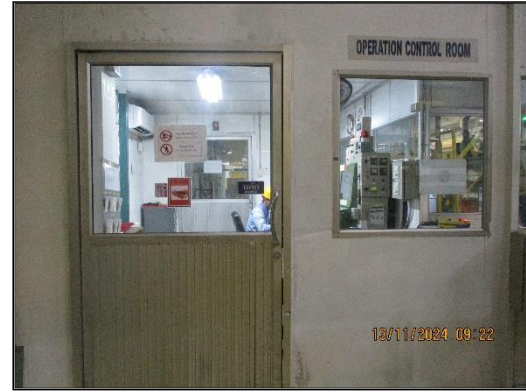
ภาพที่ 2.12 ห้องควบคุม (Control Room)