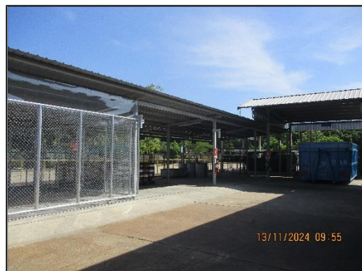
ภาพที่ 2.8 อาคารกองเก็บวัสดุที่ไม่ใช้แล้ว (Green Yard)