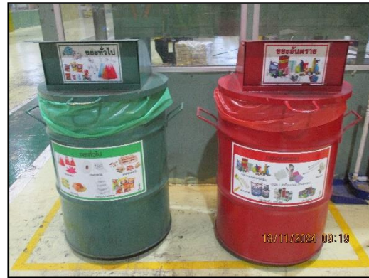
ภาพที่ 2.9 ถังขยะแยกประเภทภายในพื้นที่โครงการฯ