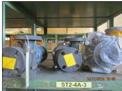
ภาพที่ 2.6 อะไหล่หรืออุปกรณ์เครื่องมือที่ใช้ในระบบบำบัดน้ำเสีย