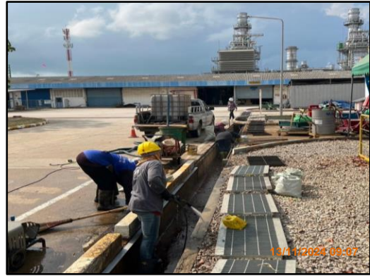
ภาพที่ 2.15 การทำความสะอาดรางระบายน้ำ