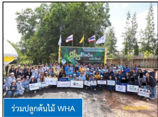
ร่วมปลูกต้นไม้ WHA