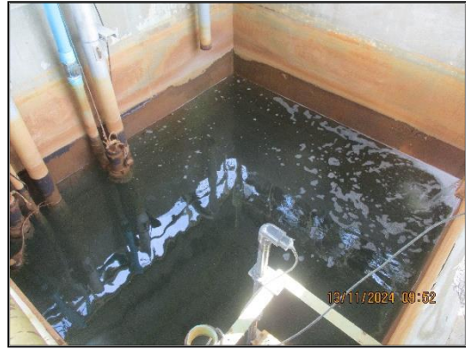
ภาพที่ 2.4 บ่อตรวจสอบคุณภาพน้ำ (Final Inspection Tank)