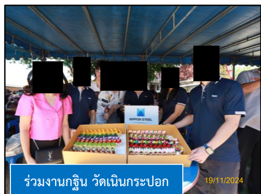
ร่วมงานกฐิน วัดเนินกระปอก