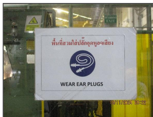
ภาพที่ 2.11 ป้ายเตือน/สัญลักษณ์บริเวณที่มีเสียงดังและให้สวมใส่อุปกรณ์ป้องกันอันตรายส่วนบุคคล