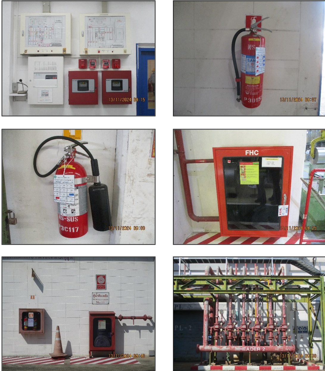
ภาพที่ 2.19 สัญญาณเตือนภัยและระบบดับเพลิงในพื้นที่โครงการฯ