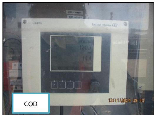
ภาพที่ 2.5 เครื่องตรวจวัดคุณภาพน้ำอัตโนมัติ