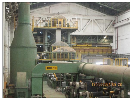
ภาพที่ 2.2 ปล่องระบายอากาศของระบบดักจับไอสารเคมี (Wet Scrubber)