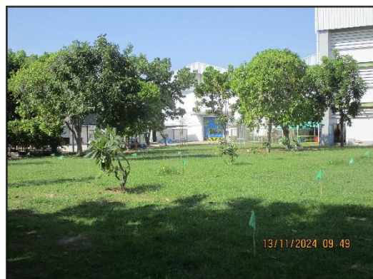
ภาพที่ 2.21 พื้นที่สีเขียวของโครงการฯ