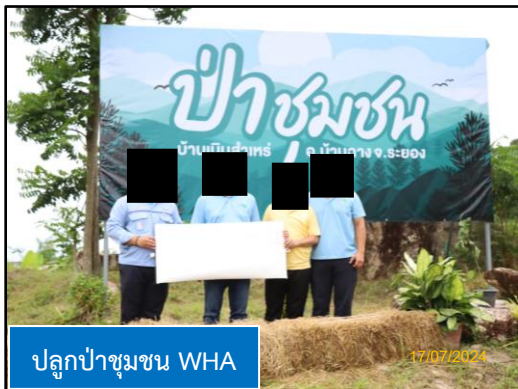
ปลูกป่าชุมชน WHA