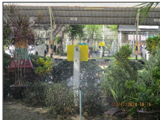
ภาพที่ 2.7 การรดน้ำต้นไม้