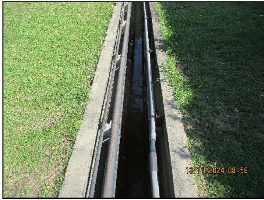
ภาพที่ 2.14 รางระบายน้ำฝนในพื้นที่โครงการฯ