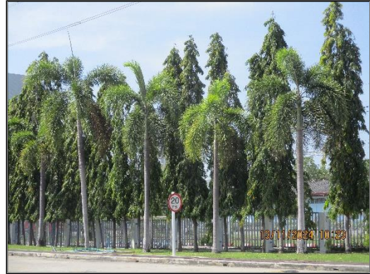
ภาพที่ 2.21 (ต่อ) พื้นที่สีเขียวของโครงการฯ