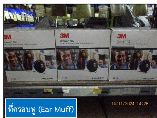
ภาพที่ 2.18 อุปกรณ์ป้องกันอันตรายส่วนบุคคลสำรองของโครงการฯ