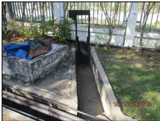
ภาพที่ 2.16 ประตูกั้นรางระบายน้ำฝนในพื้นที่โครงการฯ