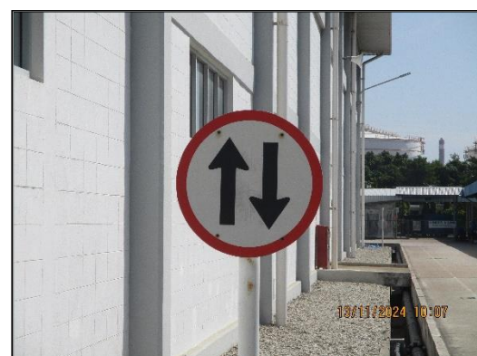
ภาพที่ 2.13 ป้ายบอกเส้นทาง จำกัดความเร็ว และสัญญาณจราจรภายในพื้นที่โครงการฯ