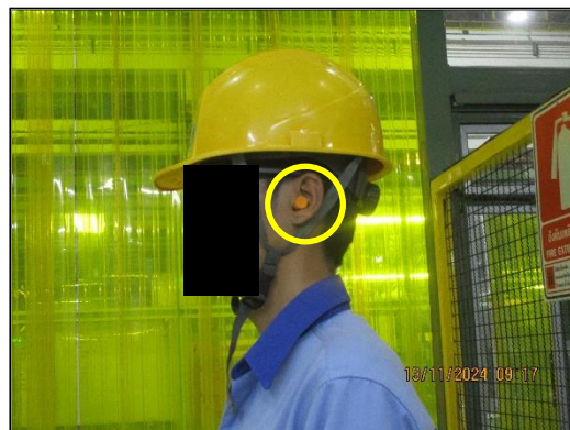
ภาพที่ 2.10 พนักงานสวมใส่อุปกรณ์ป้องกันอันตรายส่วนบุคคลขณะปฏิบัติงาน