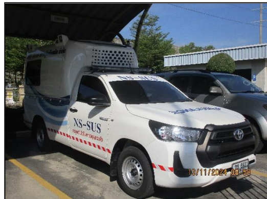
ภาพที่ 2.20 (ต่อ) ห้องพยาบาลเวชภัณฑ์ยาและรถฉุกเฉินของโครงการฯ