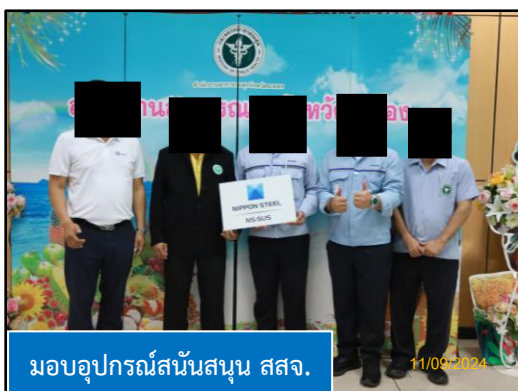
มอบอุปกรณ์สนับสนุน สสจ.