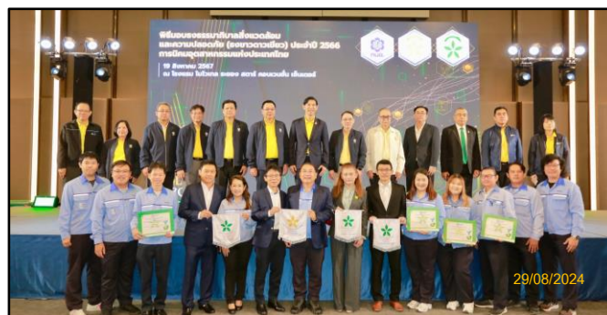
ภาพที่ 2.22 การรับรางวัลในด้านต่าง ๆ ของโครงการฯ ได้รับรางวัล “ธงขาวดาวเขียว และธงขาวดาวทอง” ประจำปี 2566)