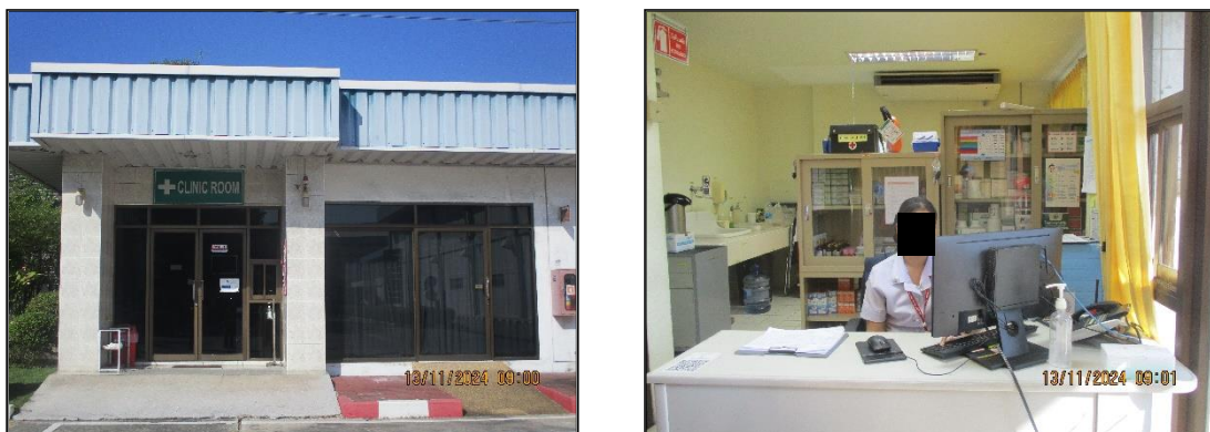
ภาพที่ 2.20 ห้องพยาบาลเวชภัณฑ์ยาและรถฉุกเฉินของโครงการฯ